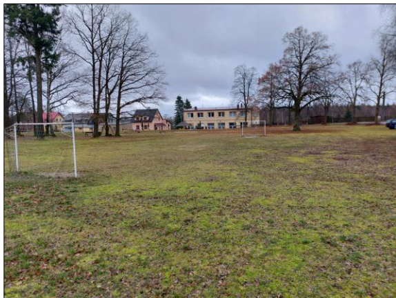
Obrázek 1 - Místo plnění (Pohled 1)

Místo plnění se nachází v Karlovarském kraji, obci Libá, katastrální území Libá, č.k.ú 681610, před budovou ZŠ Libá, pozemková parcela č. 13/1.