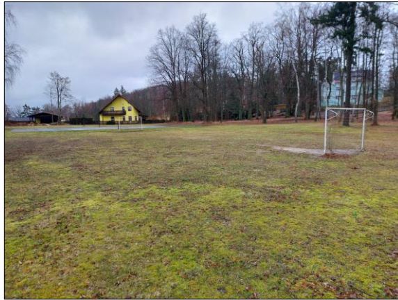
Obrázek 2 - Místo plnění (Pohled 2)