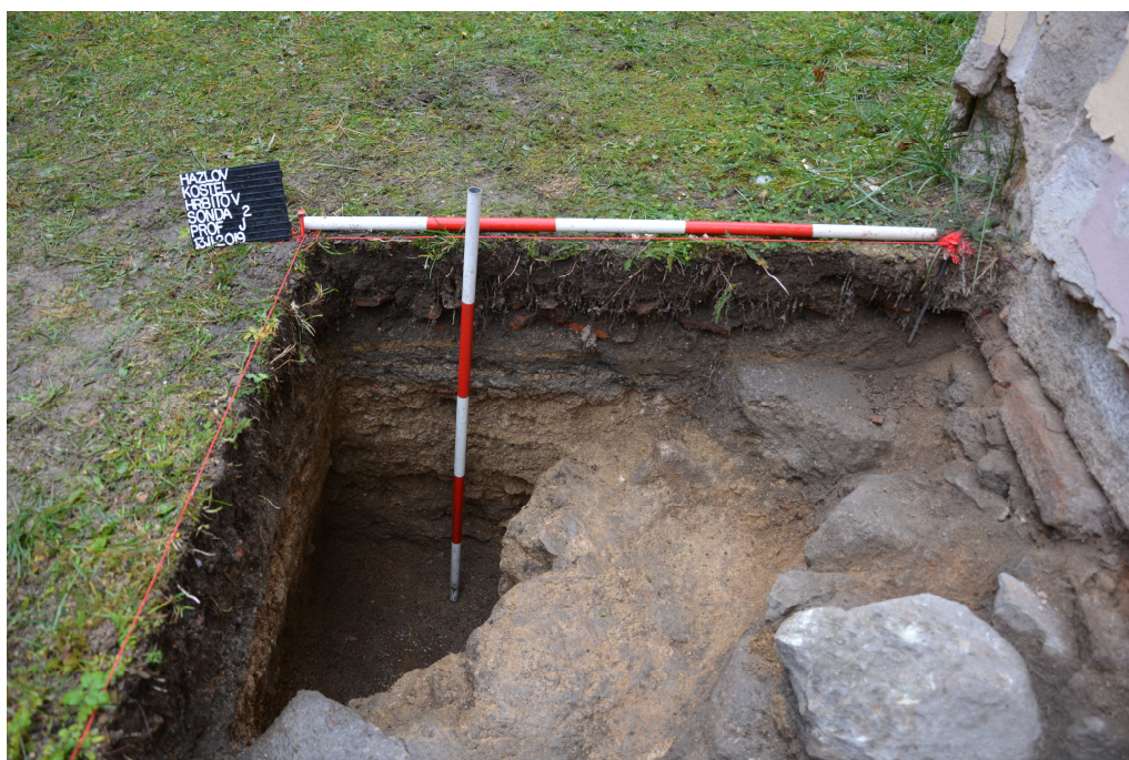
Obr. 6: Sonda 2, jižní profil sondy.