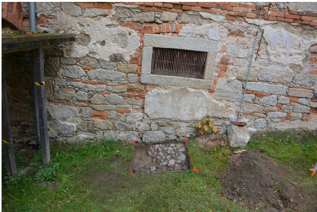
Obr. 7: Sonda 3, půdorys sondy s patrnou historickou kamennou dlažbou.