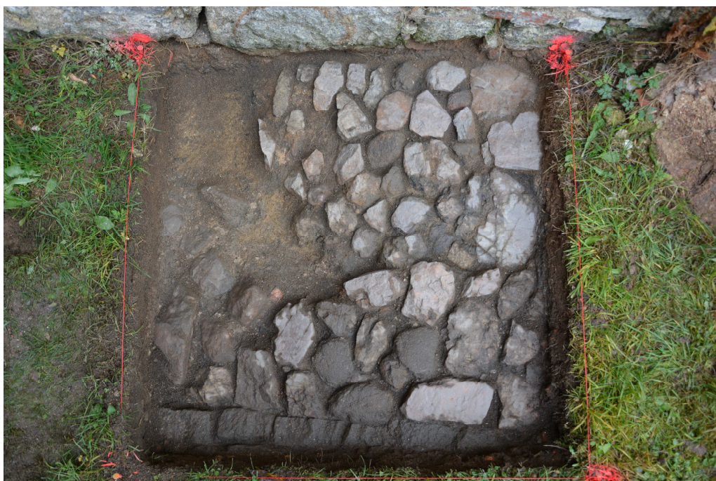
Obr. 8: Sonda 3, detail půdorysu sondy s patrnou historickou kamennou dlažbou.