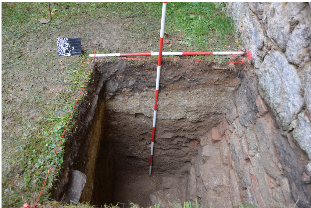
Obr. 10: Sonda 3, východní profil sondy.