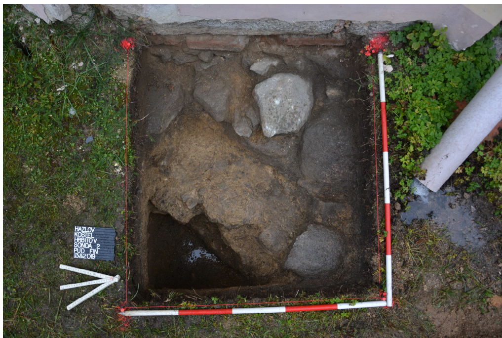
Obr. 5: Sonda 2, detail půdorysu.