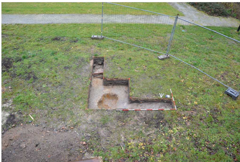
Obr. 12: Sonda 4, dokumentace půdorysu po rozšíření sondy o ramena 4A (skalní podloží) a 4B (torzo cihlovo – kamenné konstrukce).