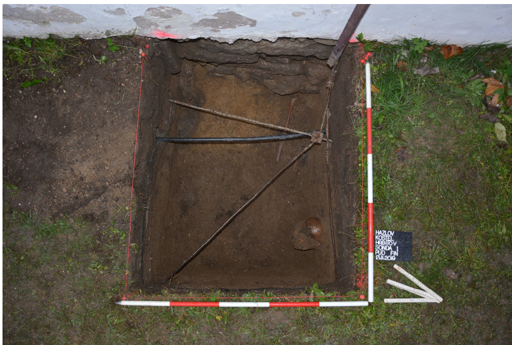
Obr. 1: Sonda 1, půdorys s patrnými kosterními pozůstatky jedinců.