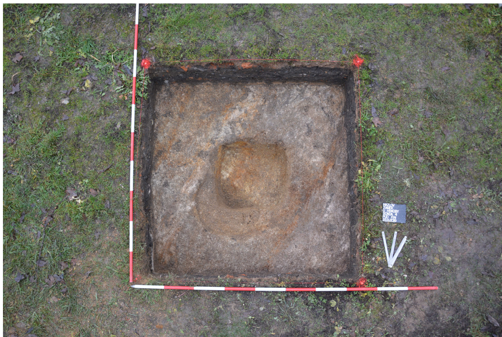
Obr. 11: Sonda 4, půdorys sondy.