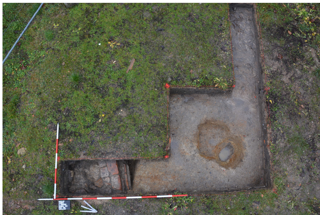
Obr. 13: Sonda 4, detail půdorysu po rozšíření sondy o ramena 4A (skalní podloží) a 4B (torzo cihlovo – kamenné konstrukce).