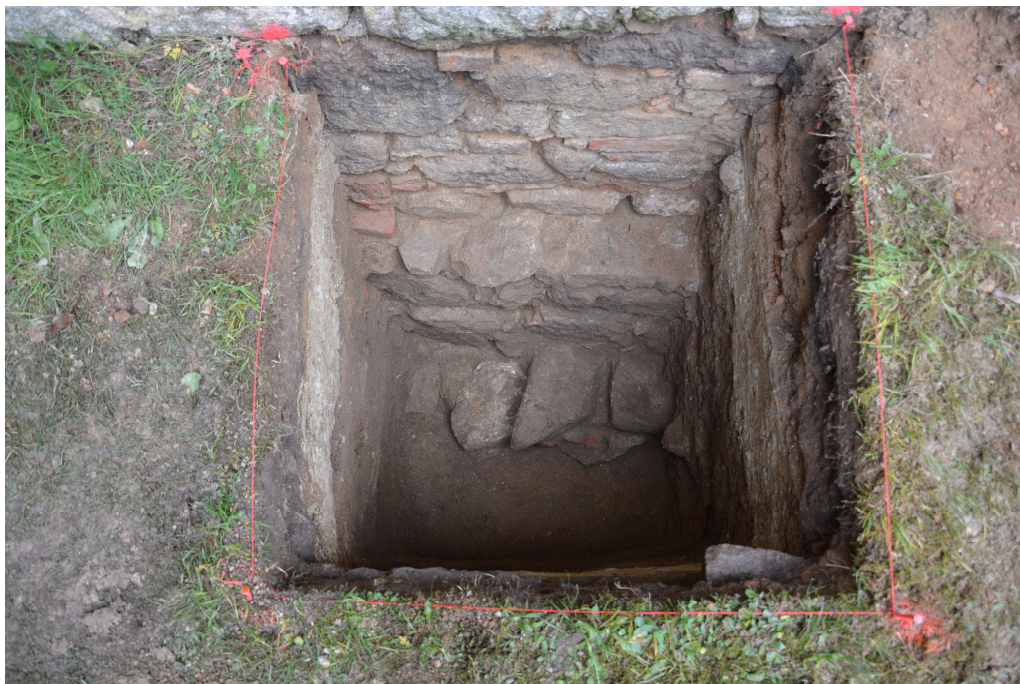
Obr. 9: Sonda 3, finální půdorys sondy s patrným základem a předzákladem budovy zámku.