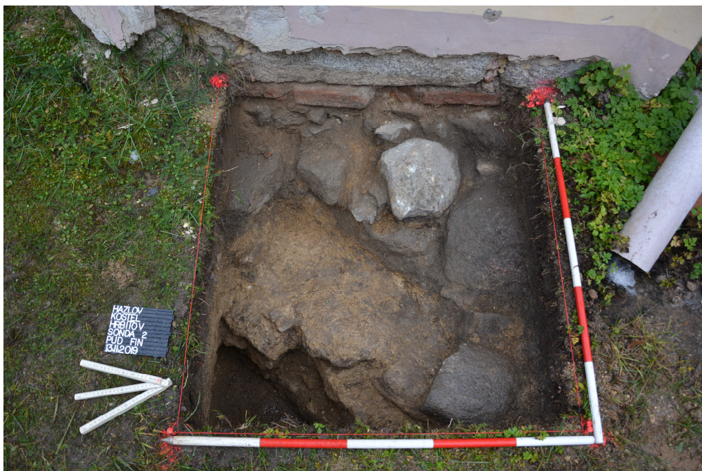
Obr. 4: Sonda 2, půdorys sondy s patrnou kamennou konstrukcí (starší fáze kostela).