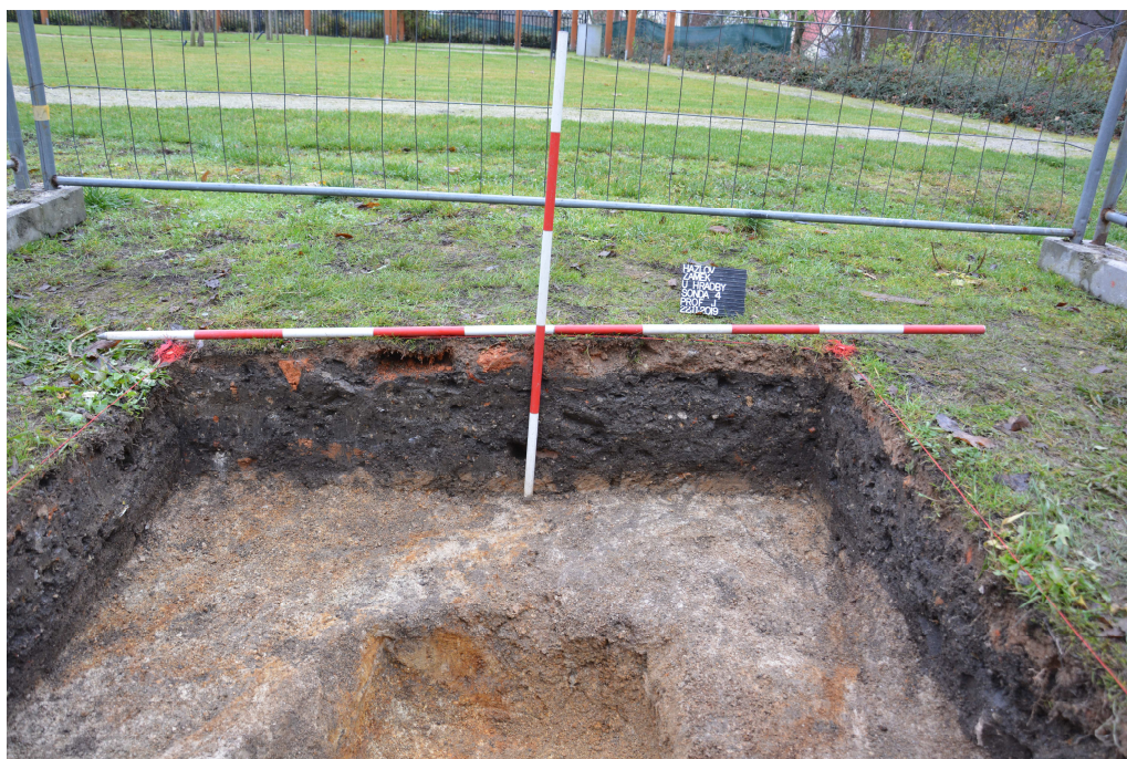
Obr. 11: Sonda 4, detail jižního profilu sondy.