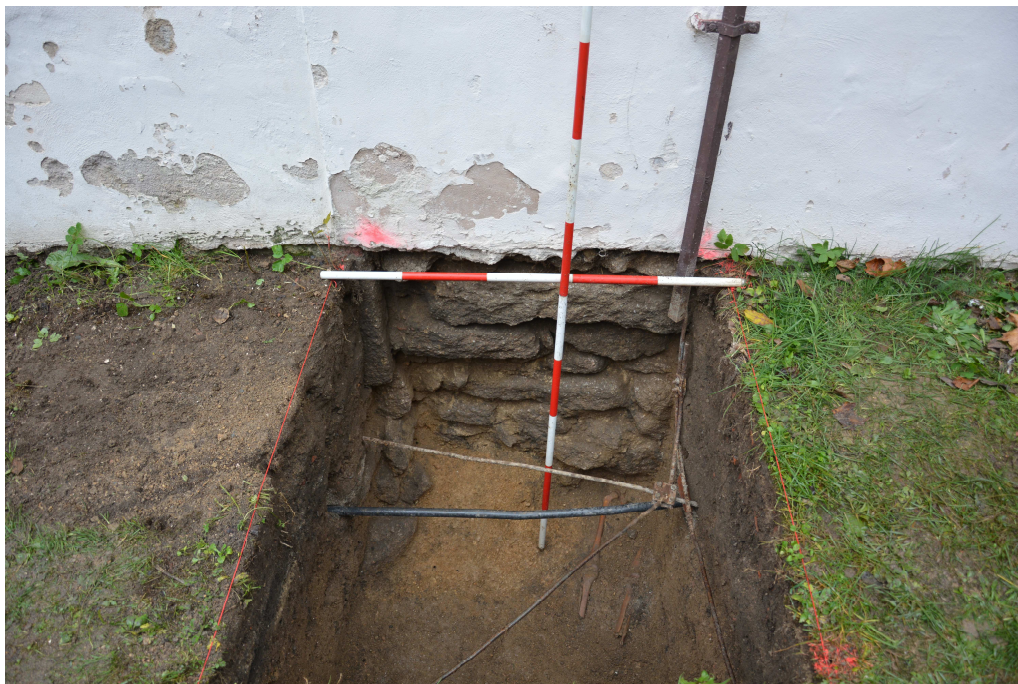
Obr. 3: Sonda 1, západní profil sondy, kamenný základ kostela po přestavbě do barokní podoby, s patrnými kosterními pozůstatky jedince ležící pod tímto základem.