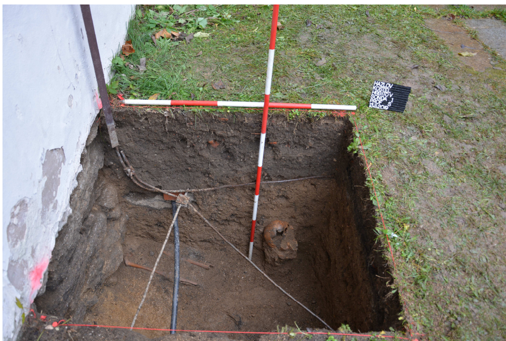
Obr. 2: Sonda 1, severní profil sondy.