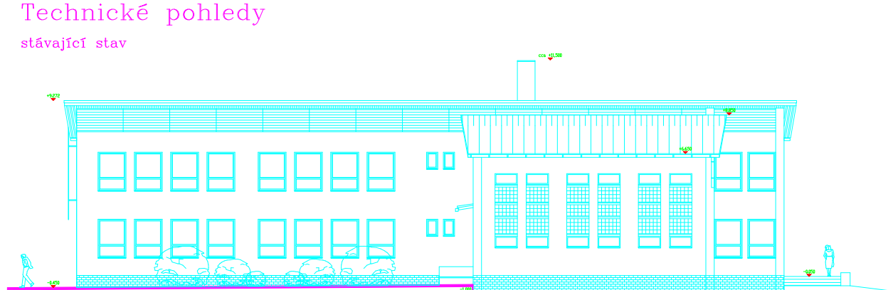
Východní pohled – boční