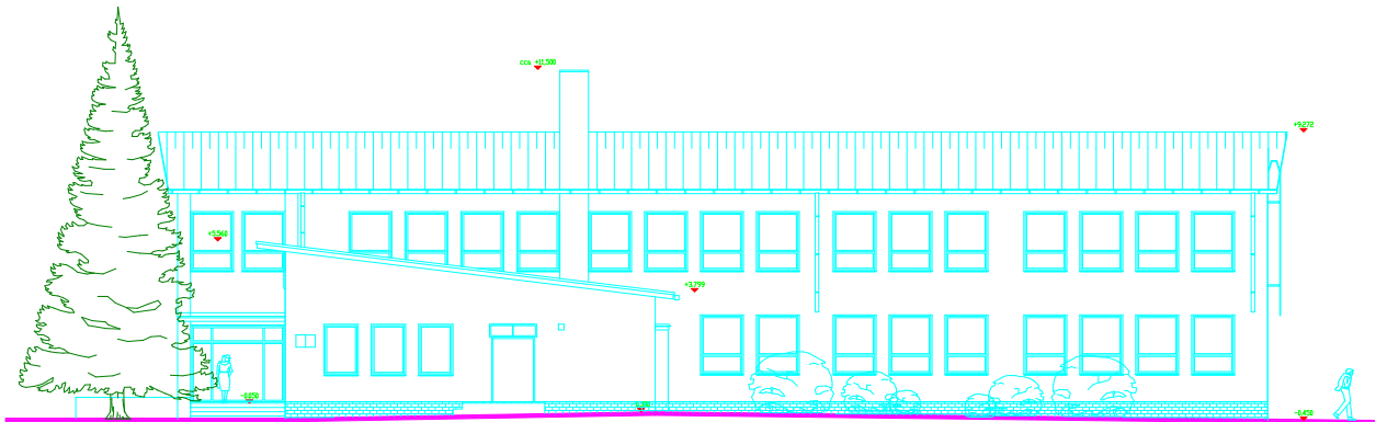
Západní pohled – boční