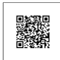
Zažádejte o vytyčení

Přílohy: Orientační zakres plynárenského zařízení, Detailní zakres plynárenského zařízení