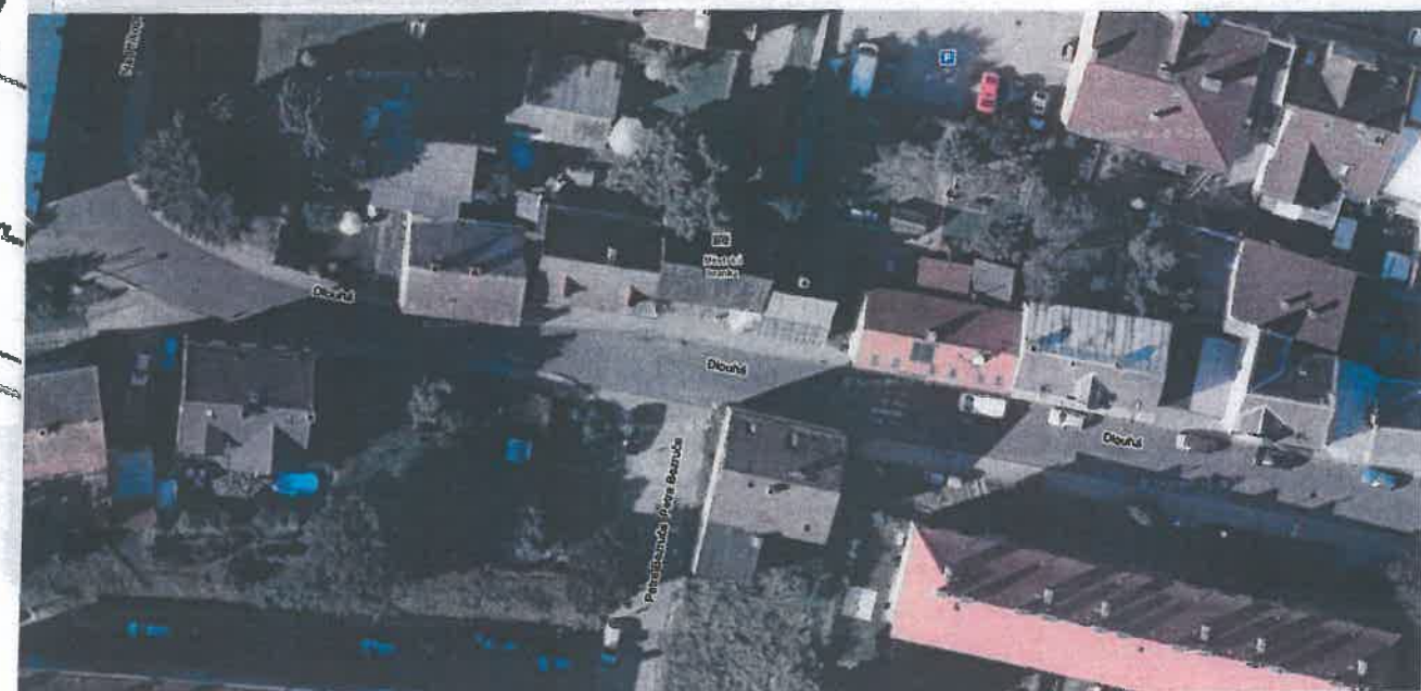
foto aktuálního stavu komunikace

Projektová dokumentace podléhá autorskému zákonu v platném znění. Žádná část této dokumentace nesmí být kopírována ani šířena jiným způsobem bez výslovného svolení autora Výkres je platný pouze v barevném provedení.