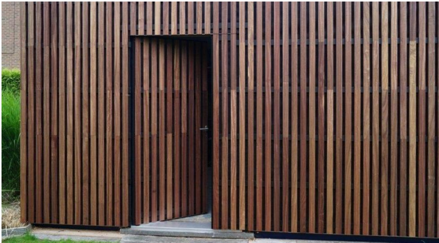
Příklady obkladu ze svislého latování